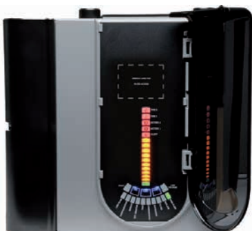
Bild 1. Rauchansaugmelder FAAST 8100E

Die Rauchansaugmelder der Reihe FAAST wurden für die Gewährleistung der Brandsicherheit in Gebäuden entwickelt, in denen die üblichen Erkennungsmethoden mit punktförmigen Brandmeldern nicht effektiv bzw. anfällig für Fehlalarme sein können.