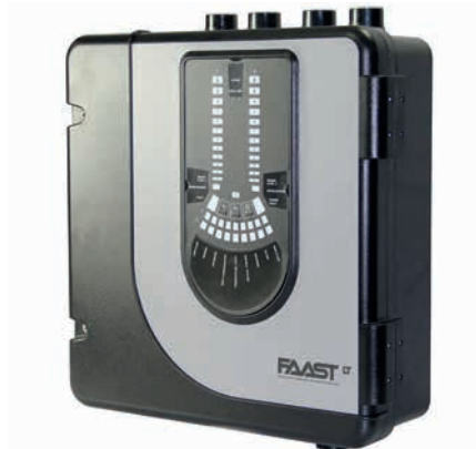
Bild 3. Rauchansaugmelder FAAST LT

Version ist ein Luftfilter intern eingebaut, um die Verschmutzung des Detektionsmoduls zu verhindern. Auch hier wird empfohlen, bei hoher Luftverschmutzung zusätzlich externe Filter einzusetzen, damit es zu keiner Beschädigung der Detektionsmodule kommen kann.