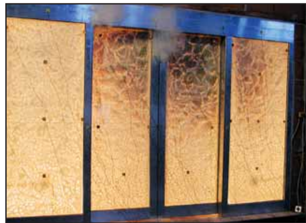
Brandprüfstand Brandschutzverglasungen - Versuchsende